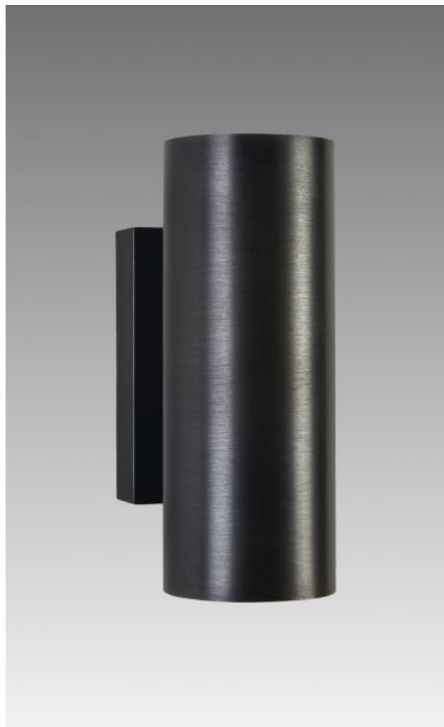
MERAK 2 in geborsteld brons